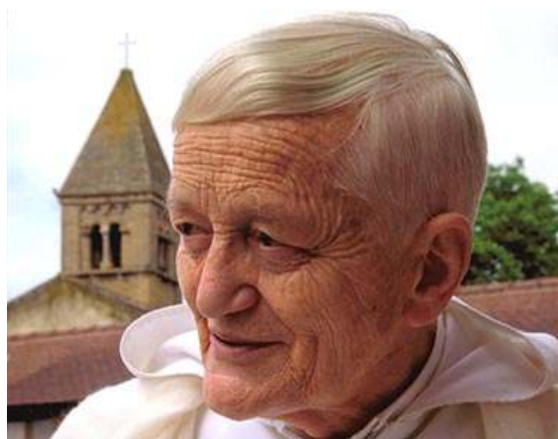
Frère Roger Schutz

Op vijftienvijftigjarige leeftijd verliet Roger Schutz Zwitserland, zijn geboorteland, en ging in Frankrijk wonen. Toen brak de Tweede Wereldoorlog uit. Roger leed aan tuberculose en tijdens zijn lange ziekbed kwam hij op het idee om een gemeenschap te beginnen als tegenwicht tegen de ellende van de oorlog, als een plek van vrede om getraumatiseerde mensen op te vangen. Hij had een mooie plek uitgezocht voor zijn schuilplaats: het dorpje Taizé lag dicht bij de demarcatielijn, de grens tussen het Franse gebied en het door de Duitsers veroverde gebied.