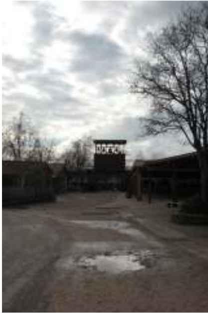
De klokken van Taizé

De ochtenddienst begon om kwart over acht, nog vóór het ontbijt. Gelukkig duurde deze niet zo lang, want ik had best honger! Bij het ontbijt stonden we even heel raar te kijken naar een soort poeder dat mensen in kommetjes schepten. We dachten dat het pap was, maar het bleek koffie, thee, melk en chocolademelk te zijn. Het poeder moest je aanvullen met heet water en dan had je te drinken. Voor de rest bestond het ontbijt uit stokbrood, jam, een minireepje chocola en een appel.