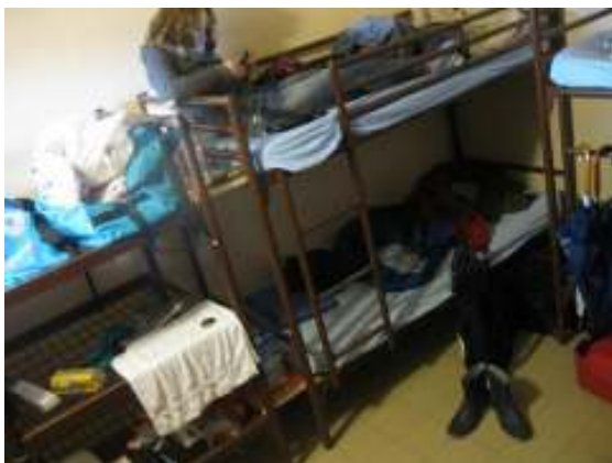
Juliëtte in een van onze kamers