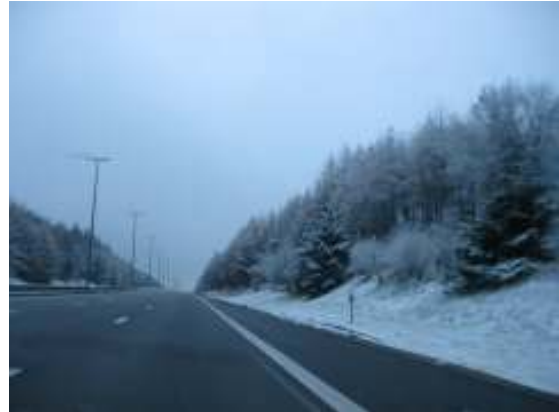
Het winterse landschap

begonnen toch wel een beetje bang te worden voor wat ons in Taizé te wachten zou staan... We hadden namelijk geruchten gehoord dat we in een soort leger tenten zouden slapen, en met die kou ons leek dat niet bepaald een pretje.