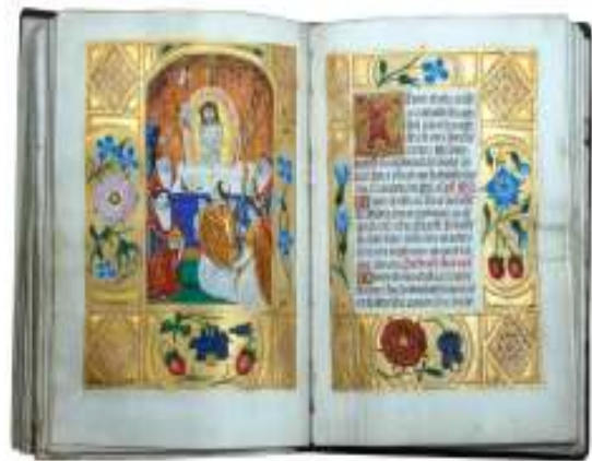
Één van de getijdenboeken

Dit zijn de boeken die het grote geld waard zijn. Ondanks dat deze boeken voor de studie van de Westerse Esoterie niet van heel groot belang zijn, en ik er hierdoor weinig over kan zeggen, zijn het wel zeer waardevolle boeken voor onze Nederlandse geschiedenis. In de collectie van Joost Ritman bevinden zich 25 middeleeuwse Nederlandse getijdenboeken. In het boek Sleutel tot het licht worden deze boeken nader belicht.