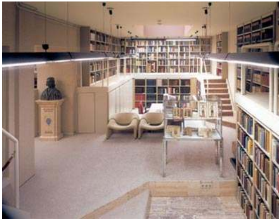
De Bibliotheca Philosophica Hermetica

Ondanks deze problematiek wil ik jullie een kijkje in de bijzondere collectie van de Bibliotheca Philosophica Hermetica niet onthouden. Ik heb de eer om een drietal werken uit zijn collectie te belichten. De werken die ik heb uitgekozen zijn daarom ook werken die ik intrigerend vind en die ik nog heel erg graag had willen bestuderen.