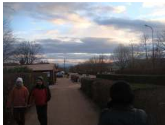
Een deel van het terrein

Er was ons verteld dat de klokken op het terrein van Taizé zouden luiden om ons op tijd wakker te maken voor de dienst, maar we waren erg blij dat we ook onze eigen wekkers hadden gezet. We hoorden de klokken wel, maar niet hard genoeg om wakker van te worden! Het eerste wat ik die ochtend deed was douchen. Ik was erg blij dat ik mijn wekker vóór de klokken had gezet, want toen ik klaar was stond er een rij.