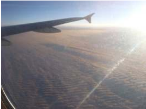
Vanuit het vliegtuig

I just got back from Rome the other night! I finally caught up on some much needed rest so now it's epic blog time. I had an incredible week visiting churches/crypts/museums/palazzos/etc. all day every day, and don't even know where I should start, but here's the low down on my trip.