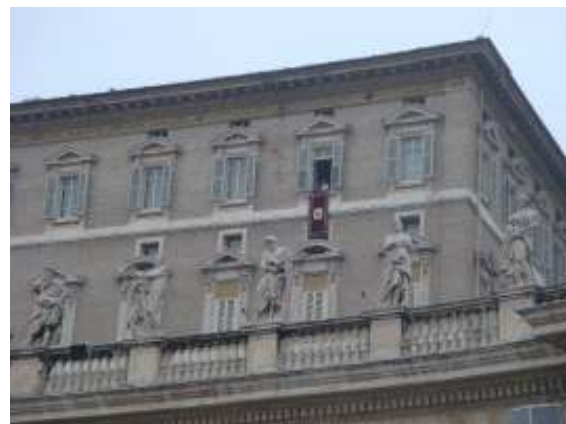
Toespraak van de Paus

lot of people seemed to be freaked out by the crypt but I thought it was beautiful. I especially liked the message in the 5th chapel: "What you are now we used to be; what we are now you will be." I couldn't have put it better myself. Cruised around the city for the rest of the evening, was supposed to meet up with Eden but that fell through so I ended up at the hostel's bar for a few drinks with my buddy Aron after seafood spaghetti at a nearby restaurant.