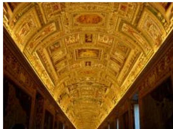
Eén van de gangen in het Vaticaan museum

St. Peter's Basilica! So insanely huge and beautiful and otherworldly. I can't express how impressive visiting this church was for me; its sculptures, relics, paintings, altars, stained glass windows, tombs and chapels are truly some of the world's greatest riches. I climbed the 551 stairs all the way up to the top of the dome to see the amazing view from there, and went down to the tombs below the basilica where many popes, martyrs and possibly St. Peter's own remains are laid to rest. After perusing these holy grounds for several hours we went to the Vatican Museum which also holds an insane collection of art. The highlights here was of course the Sistine Chapel, covered in frescoes by Michelangelo. Since it was the birthday of one of our classmates, our entire group went out to dine together (Roman artichoke, spaghetti with anchovies, and creme brulee for me) which was nice. Eden came to pick me and 2 friends up to go to a bar where I made some new friends and drank cocktails all night. Unfortunately she had to leave early but I was stoked to catch up with her again.